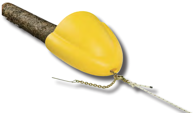
Zugschale PCA-1290 für Holzstämmen bis zu 50cm Durchmesser 149,00 incl.

...passende Erweiterungen für das Jäger- / Holzwerber-Sortiment: