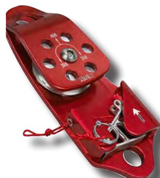
Seilbremse PCA-1271, automatisch blockierend, Verwendung zur Vorspannung und sicheren Halten 209,00 incl.