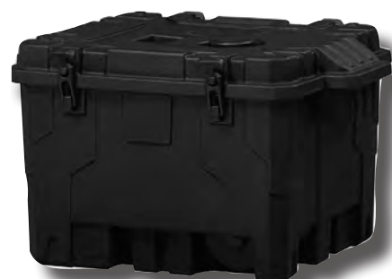
Transportkoffer PCA-0100 mit vorgeformten Mulden 269,00 incl.